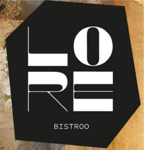
Local Kalamaja community bistro. Casual and delicious!